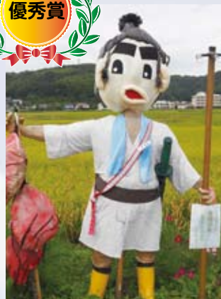
16 大江かかし研究会(大江)