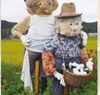
12 小規模多機能こよし(高屋)