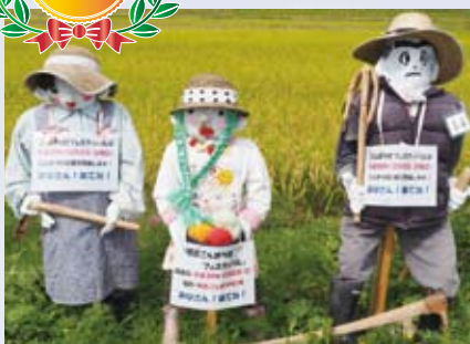
14 明治公民館 (芳井)