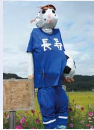
3 いばら長寿の里(上出部)