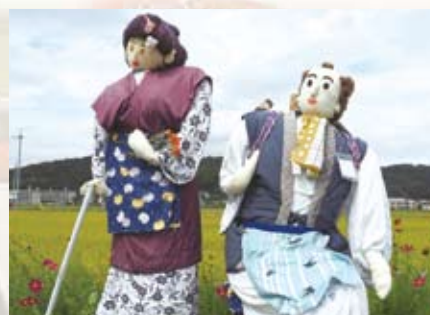
10 サービスハウスえすぽ (笠岡)