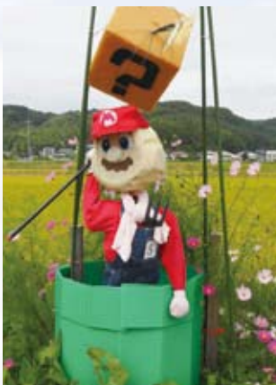
5 ラスパみずき(下出部)