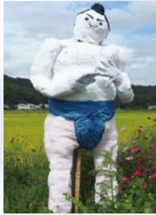
2 小田川荘 (芳井)