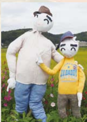
11 なかまの会 (芳井)