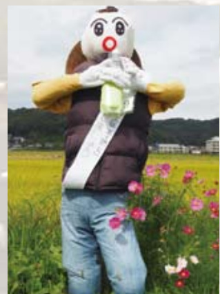
9 ドルフィン岩倉(岩倉)