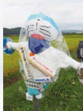
20 井原子どもボランティア 赤羽根共同募金 (井原)