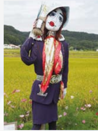
4 グループホーム いづえ楽寿(笹賀町)