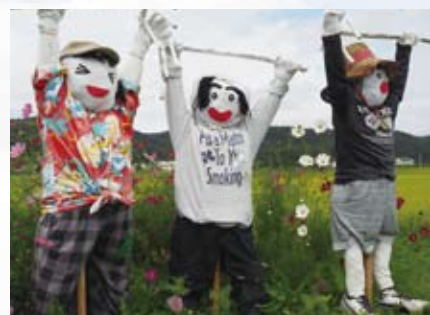
7 サンサンリビング いばら楽寿 (下出部)