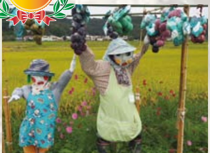
8 サントピア (上出部)