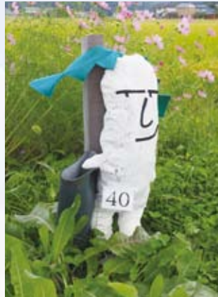
40 赤城友治さん (笠岡)