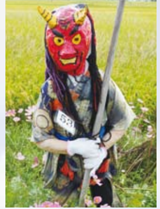
53 三村ファミリー(井原)