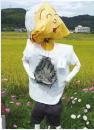
1 ケアハウス四季が丘(上出部)