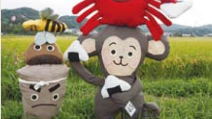
45 RIOKANNPO ジュニアフットサルスクール (木之子)