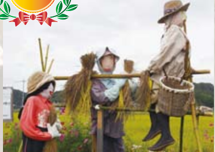
13 青野いきいきサロン たんぽぽ (青野)