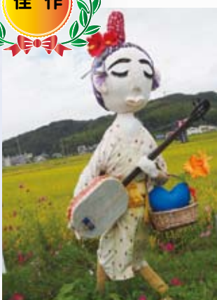
17 折口サロン となり組 (大江)