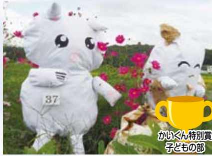
37 岡田志歩さん (小6)