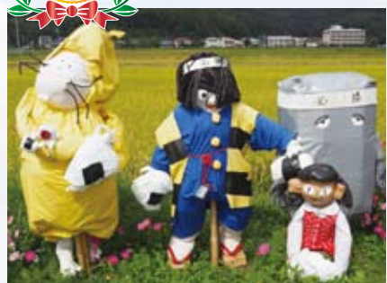
6 さくらデイサービス 子守唄の里高屋 (高屋)