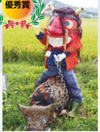
50 きのご エスポアール物部(笠岡)