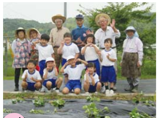
6/17 小学校 さつま芋植え