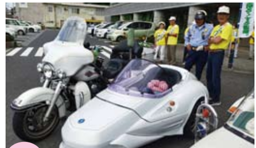
7/4 社会を明るくする運動 ハーレーパレード