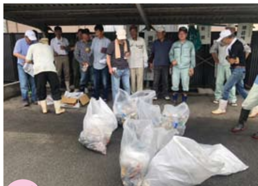
6/23 アースラブ 美化活動