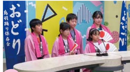
5/28 鳥羽踊り子ども伝承教室 受講生募集 (井原放送)